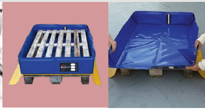
Ausstattungs- möglichkei- t mit einer Aus- lauföffnung und einem Kugelventil