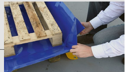
Falten der Ecken

Die Ecken sind nicht geschweißt, daher ermöglichen sie ein bequemes Falten der Wanne rund um die Palette