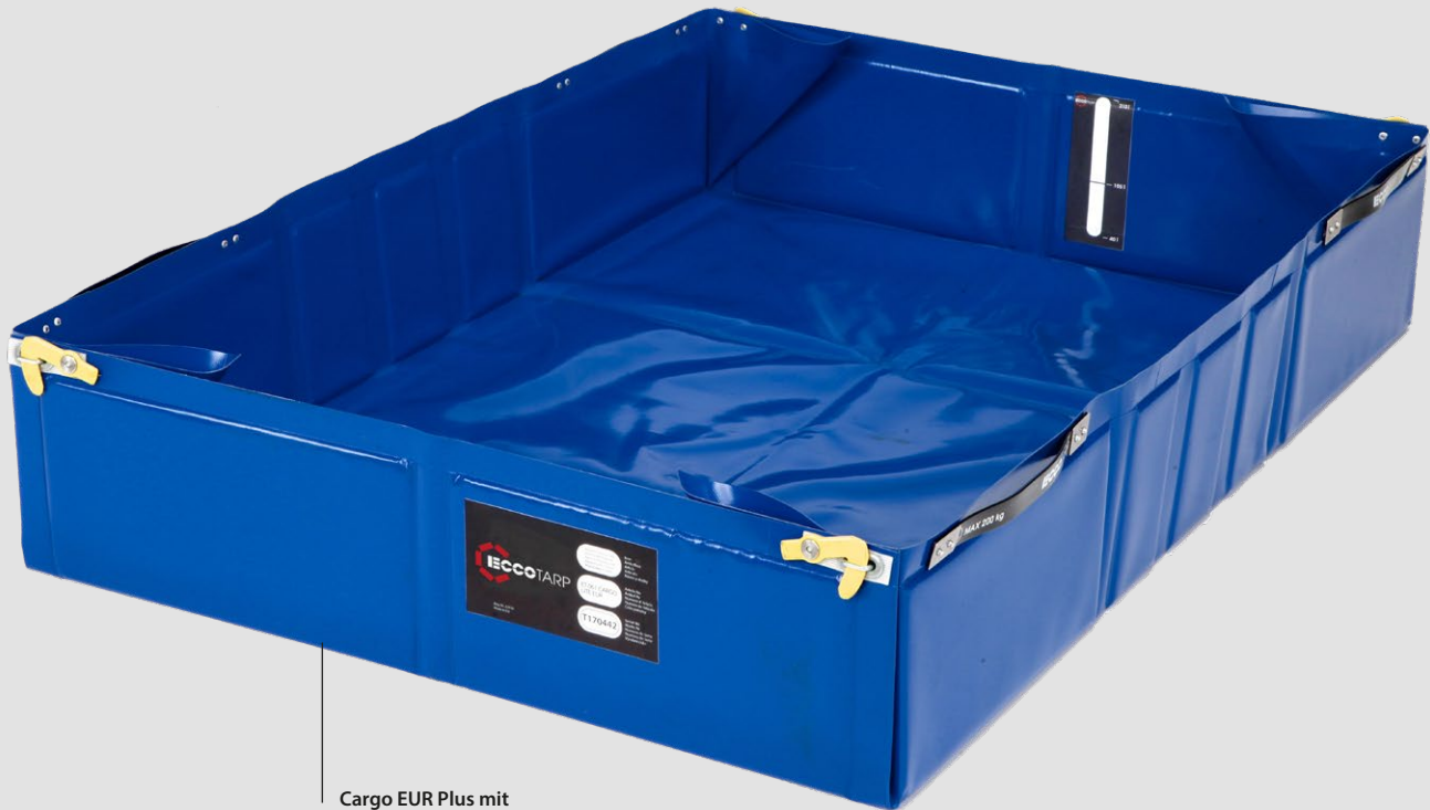
Cargo EUR Plus mit Handlingsgriffen