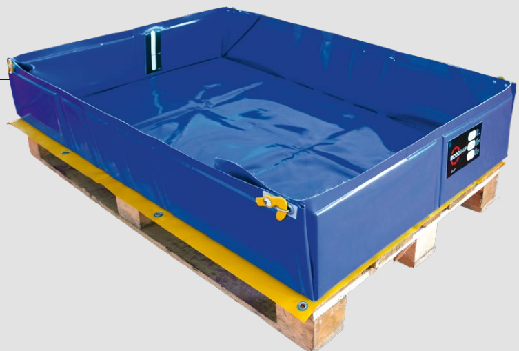
Cargo EUR ohne Handlingsgriffen

Ihre Form und Größe wurden speziell für die Industrie- und Transportanwendungen entwickelt