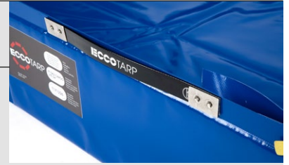
Detail eines Handlingsgriffen