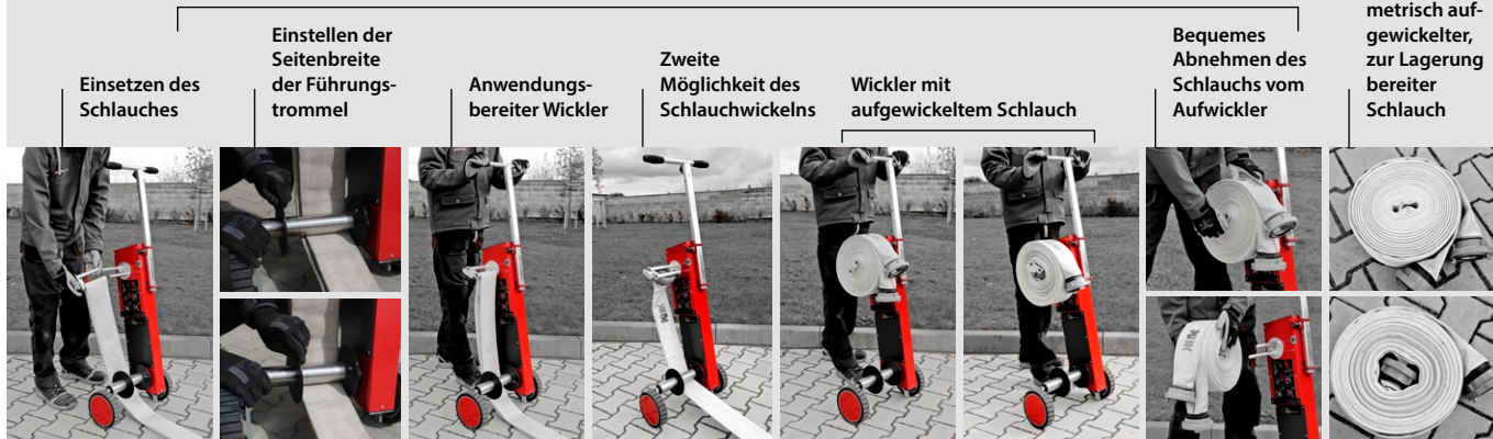
Einsetzen des Schlauches