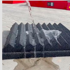
Rohože mají speciální povrchovou úpravu proti nasákavosti