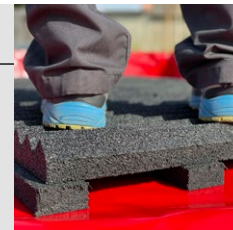
Doporučený způsob skladování