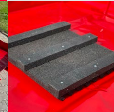
Rohože jsou přednostně určeny pro umístění v Dekontaminačních vanách IZS