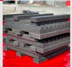
Detail povrchové struktury