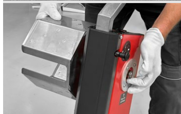
Možnost navíjení za chůze