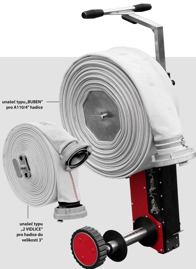
unašeč typu „2 VIDLICE“ pro hadice do velikosti 3"