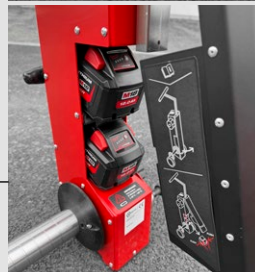
Elektromotorický pohon na aku baterie