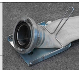
Chránič hadice pro ochranu požární hadice i koncovky proti odření v průběhu navíjení