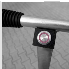
Tlačítko WORK na rukojeti